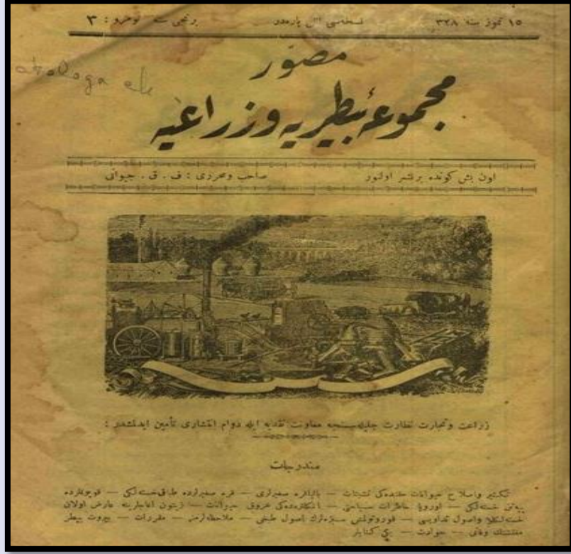
Şekil 1a. Musavver Mecmûa-i Baytarîyye ve Zirâiyye'nin birinci sene üç numaralı sayısının ön dış kapağı Figure 1a. The front cover of the first year number three issue of Musavver Mecmua-i Baytarîyye ve Zirâiyye